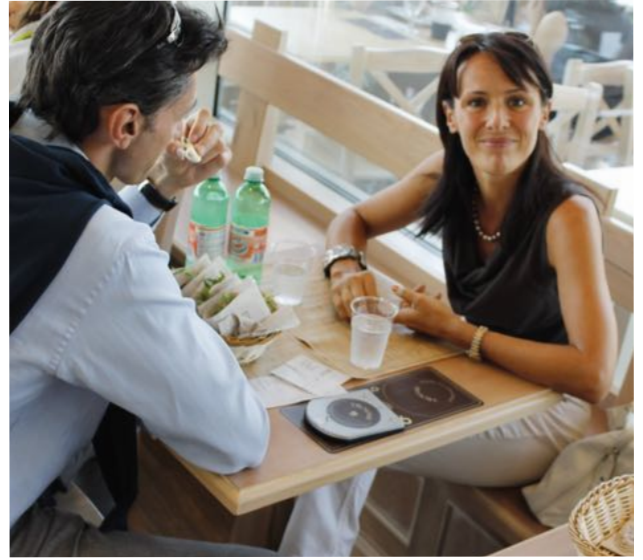
Vandalisuojaattu RFID Tagi alusta Dispensa Emilia, Bologna, Italia

Edullinen ratkaisu -RFID Tagit pöydän reunoilla alapinnassa. Forni Rossi, Poznan, Puola