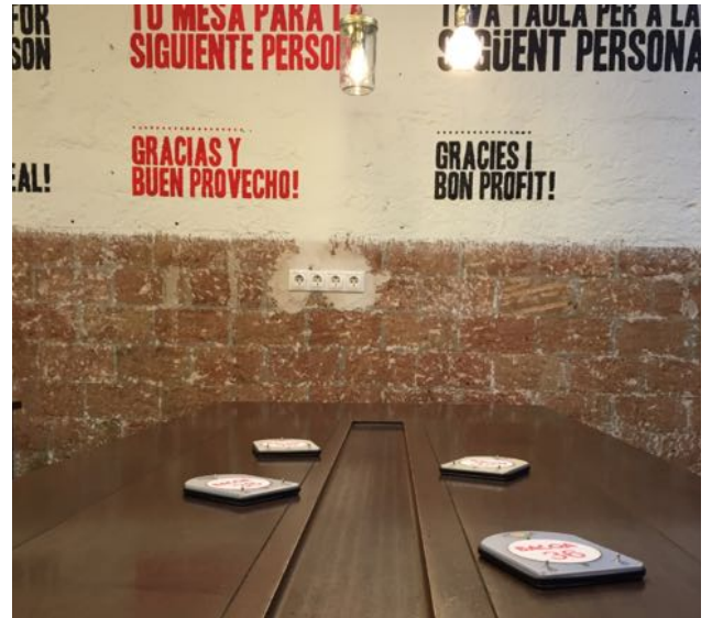
Koko pöydän alapintaan asennettu Tagit BACOA, Barcelona, Espanja

Tagit voi asentaa myös pöydän pintaan. Tällöin yläpinta tulee suojata esim. muovikalvolla, levyllä tai lasilla.