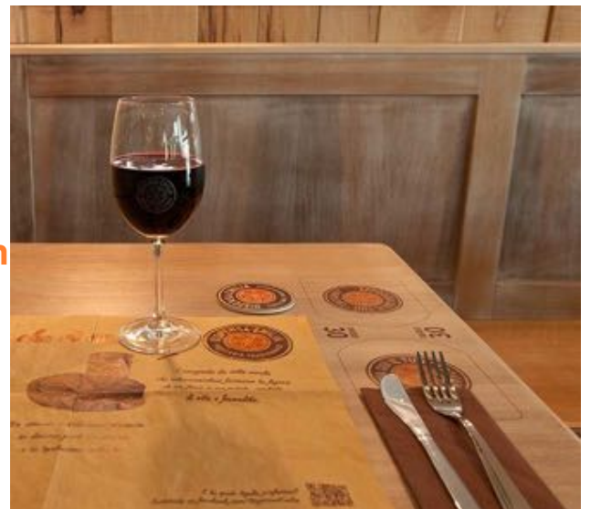
Maalatut tunnustinalue merkit puupöydissä Dispensa Emilia, Modena, Italia